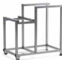
Socle - chariot