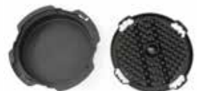
Kit nettoyeur de grilles