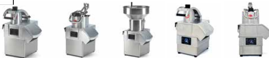
Tableau de caractéristiques