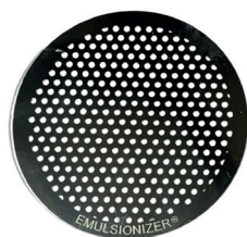
Disque moulin à légume